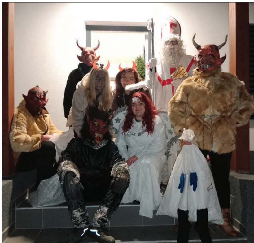
Mikuláš, anděl a čerti navštívili na začátku prosince děti ve Zdislavicích. Všechny byly hodné, čert si žádné do pekla neodnesl.