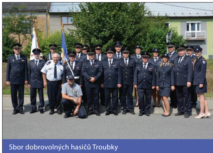
Sbor dobrovolných hasičů Troubky