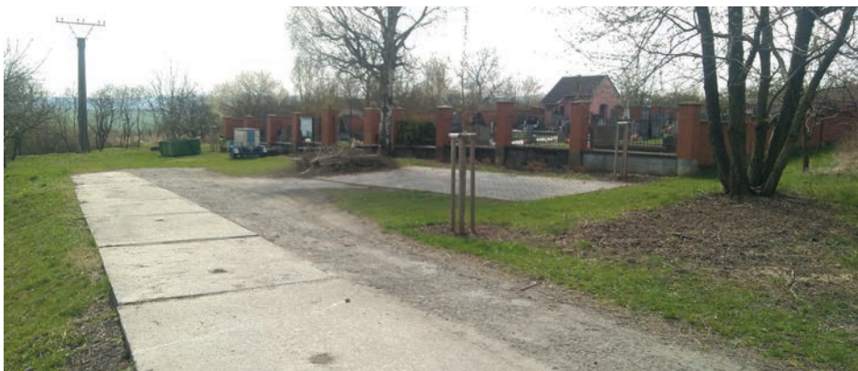
Návštěvníci hřbitova se po opravách cesty pohodlně dostanou na parkoviště i za špatného počasí.

Z cesty u zámku je sjezd ke hřbitovu, který tvoří panely. Okolo nich je hliněný